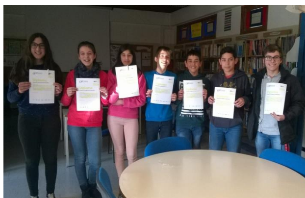
Escola Básica da Lajeosa do Dão