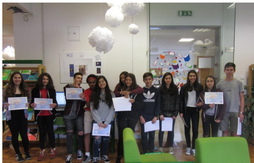
Escola Secundária de Molelos