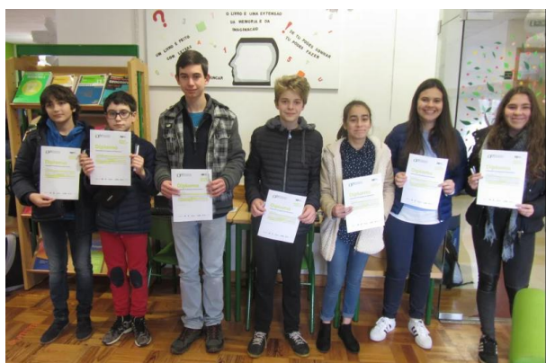
Escola Secundária de Molelos