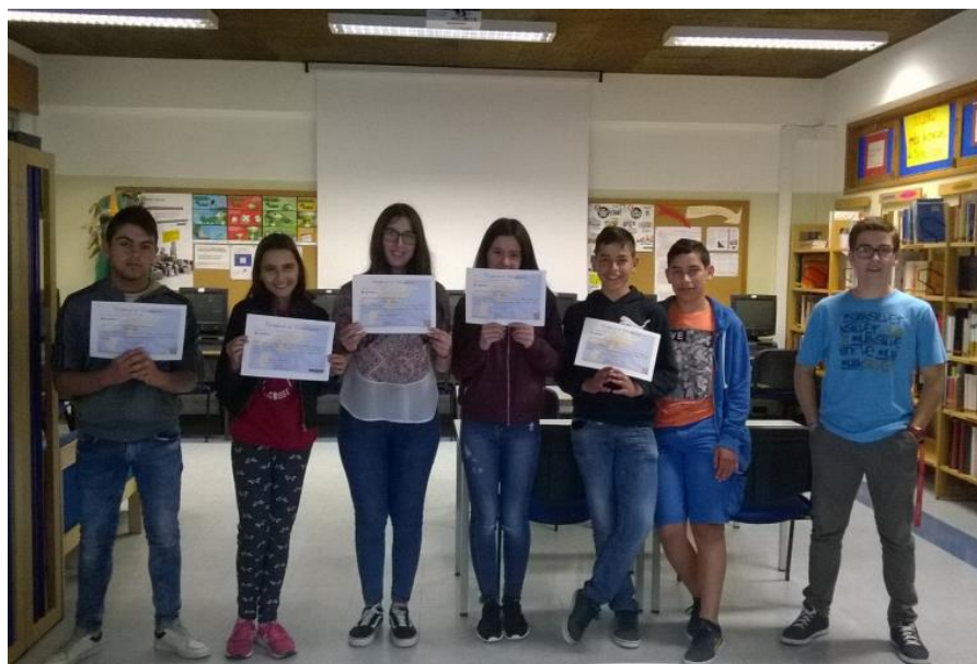
Escola Básica da Lajeosa do Dão