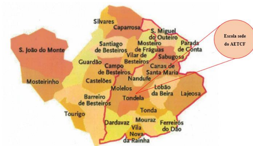
Figura 1 - Localização geográfica da Escola sede AETCF

O AETCF abrange uma área geográfica dispersa, delimitada conforme a fig. 1, distando as escolas mais longínquas que o integram cerca de 14 Km entre si, localizadas na área Sul/Sudeste do concelho de Tondela.